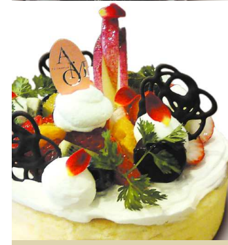
9 チーズケーキ フルーツ仕上げ

5.5号 / 16.5cm 3,300円 6号 / 18cm 4,100円 7.5号 / 22.5cm 5,800円