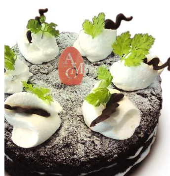
5 クラシックショコラ

4号 / 12cm 2,500円 5号 / 15cm 3,400円 6号 / 18cm 4,200円 7号 / 21cm 5,500円