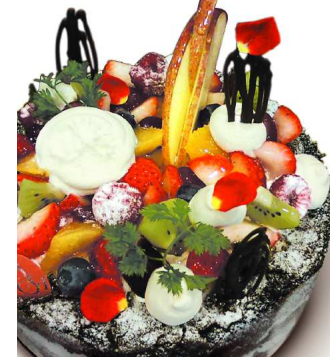
6 クラシックショコラ フルーツ仕上げ