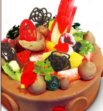
4 アモスペシャルティ チョコクリーム

4号 / 12cm 2,300円 5号 / 15cm 3,200円 6号 / 18cm 4,000円 7号 / 21cm 5,300円